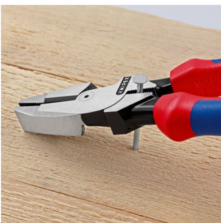
Область захвата под шарниром для мощного рычажного усилия