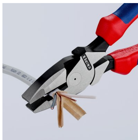
Продольное резание для разделения плоских кабелей