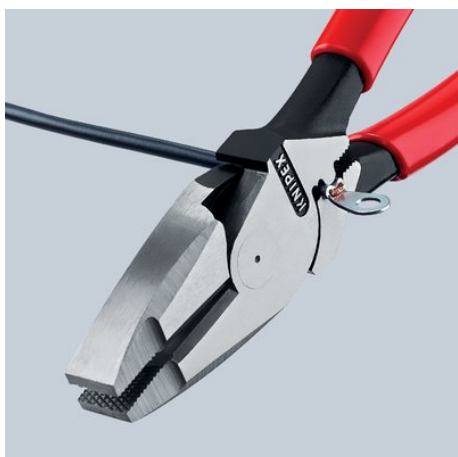
09 11/12 240: универсальный шипообразный обжим под шарниром