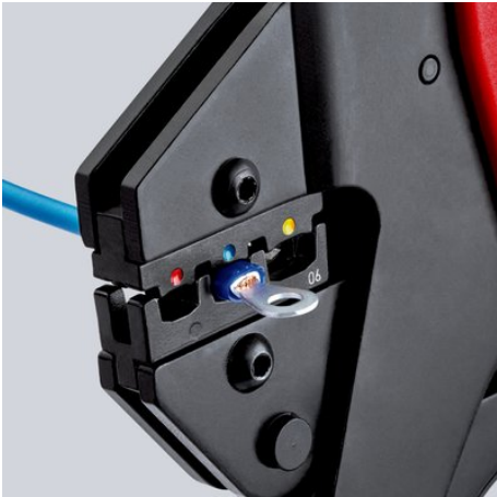
97 43 200 с опрессовочной палашкой 97 49 06 для изолированных кабельных наконечников, штекерных и стыковых соединителей