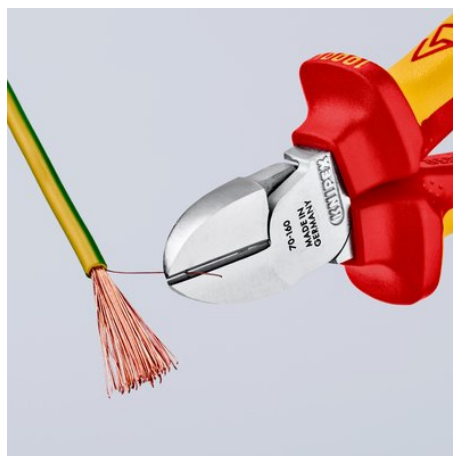
Чистый рез тонкой медной проволоки, даже кончиками кромок