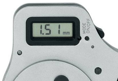
Мультифункциональный дисплей, настройка в мм, дюймах или сравнимые позиции для выбора согласно MIL